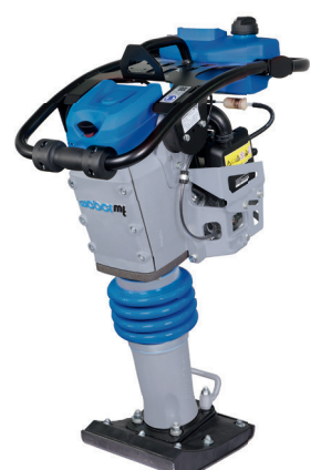
SRV 660 Hd