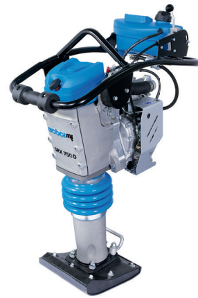
SRX 750 D

Zur Verdichtung unter beengten Platzverhältnissen und zum Unterstopfen von Leitungen und Rohren.